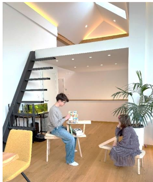
Slika 7: mica stolec za branje pravljic