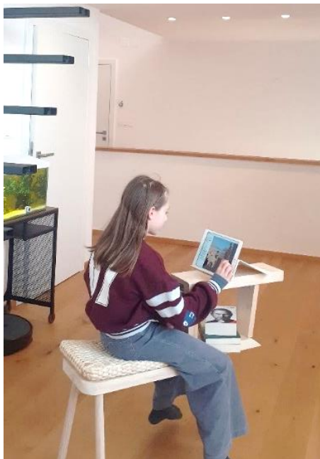
Slika 8: mica stolec in delo na tabličnem računalniku

Izbrali smo kakovosten, naraven in svetel les, ki odseva trpežnost, toploto in moderno estetiko (Deu, 2024, str. 140 - 182).