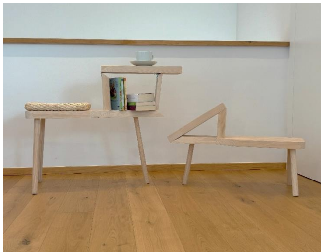
Slika 6: mica stolec za otroke v modernem interiorju

Lesen sedež, ki se nam je zdel hladen, smo oplemenitili s pomelajevim biljem. Tako mica stolec deluje bolj toplo, sedenje na njem pa je udobnejše.