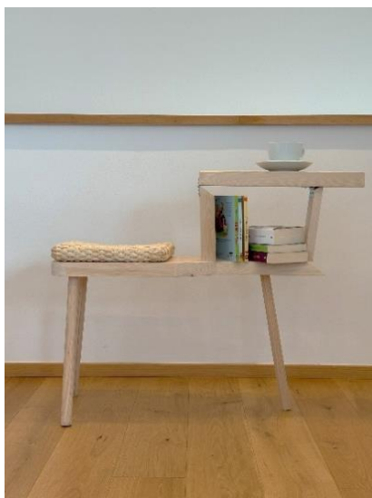
Slika 5: mica stolec.

Pripravili smo tudi posebno različico mica stola za otroško sobico. Z zaobljenimi robovi, stabilno konstrukcijo in naravnimi materiali ter prilagojeno velikostjo. Stol se spremeni v manjšo otroško mizico za risanje, igro ali učenje, spodaj pa je prostor za shranjevanje igračk ali otroški knjižic. Po želji in naročilu kupca lahko izdelamo tudi stol s tradicionalnim (sicer prilagojenim) zobatim nastavkom, ki omogoča možnost senzorične igre. Ko je mizica zaprta, dobimo obliko konjička, ki lahko služi za igro ali za dekoracijo v otroški sobici.