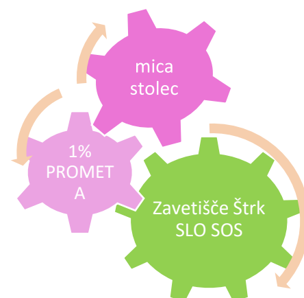
Slika 12: Shema vrni naravi

Velika potovanja so iz majhnih korakov. Ko smo oblikovali blagovno znamko, smo se odločili, da 1 % prometa od nakupa turističnega proizvoda From Palček Polanski vrnemo naravi. Obiskovalci bodo z nakupom mica stolca 1 % od plačila za nakup hrane za živali v sklopu Rečne šole ter za zavetišče štorkelej Štrk SLO SOS pri Copekovem mlinu in s tem omogočili boljše življenje štorokljam, ki v naravi ne bi zmoгле preživeti.