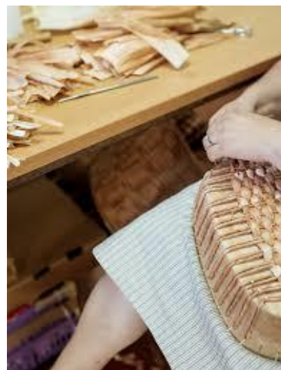
Slika 3: Pomelajevo bilje

Pomelajevo bilje ni preprosto koruzno ličje, temveč je dragoceno gradivo, čigar prave lastnosti nastajajo celo leto. Pomelajevo je območje, kjer skrbno gojijo avtohtono vrsto prekmurske koruze trdinke (mora biti devet redna), ki je najbolj primerna za pletenje. Zato pri Pomelaju vsako leto posejejo trdinko in jo na to v jesenskem času tudi tradicionalno – ročno potrgajo. Bilje nato ročno ločijo od koruznih storžev. Šele ko je bilje zares suho in ga pletarji pred zvijanem v vrvice prav omočijo, le to dobi svilen otip in poseben sijaj, v katerem se razkrijejo naravni odtenki od bele prek rumene do vijoličaste. Postopek pridelave in priprave bilja poteka v več korakih ( Priloga 2).