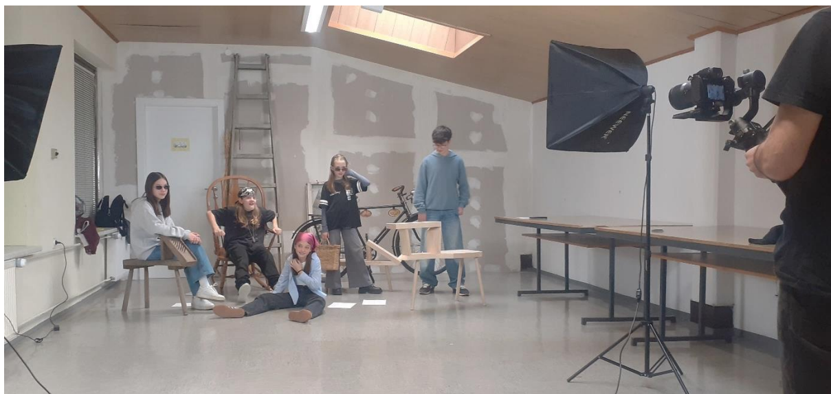
Slika 10: Snemanje video spota v šoli

Zanimivo in zabavno je bilo tudi snemanje video spota oz. promocijskega videa na različnih lokacijah.