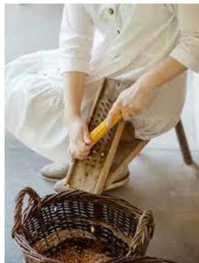
Slika 4: Stol za lüščenje koruze

Še sreča, da so ga ohranili v Zadrugi Pomelaj, kjer se lahko v lüščenju kukarce preizkusijo turisti in na ta način spoznajo tradicijo, ki izginja. Ko smo podmladkarji Velika Polana organizirali dogodek Po poti Palčka Polanskoga za vodje zdravih šol Pomurja, smo priredili celo tekmovanje v lüščenju kukarce. Zmagovalka je seveda dobila za nagrado Palčka Polanskoga in koruzni storž trdinke.